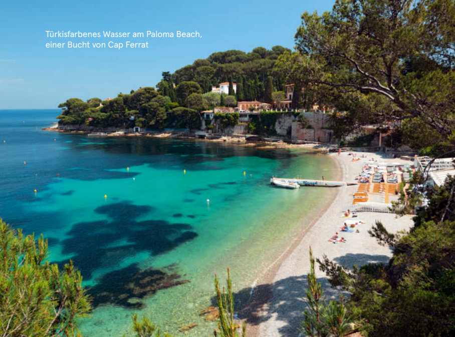
Türkisfarbenes Wasser am Paloma Beach, einer Bucht von Cap Ferrat