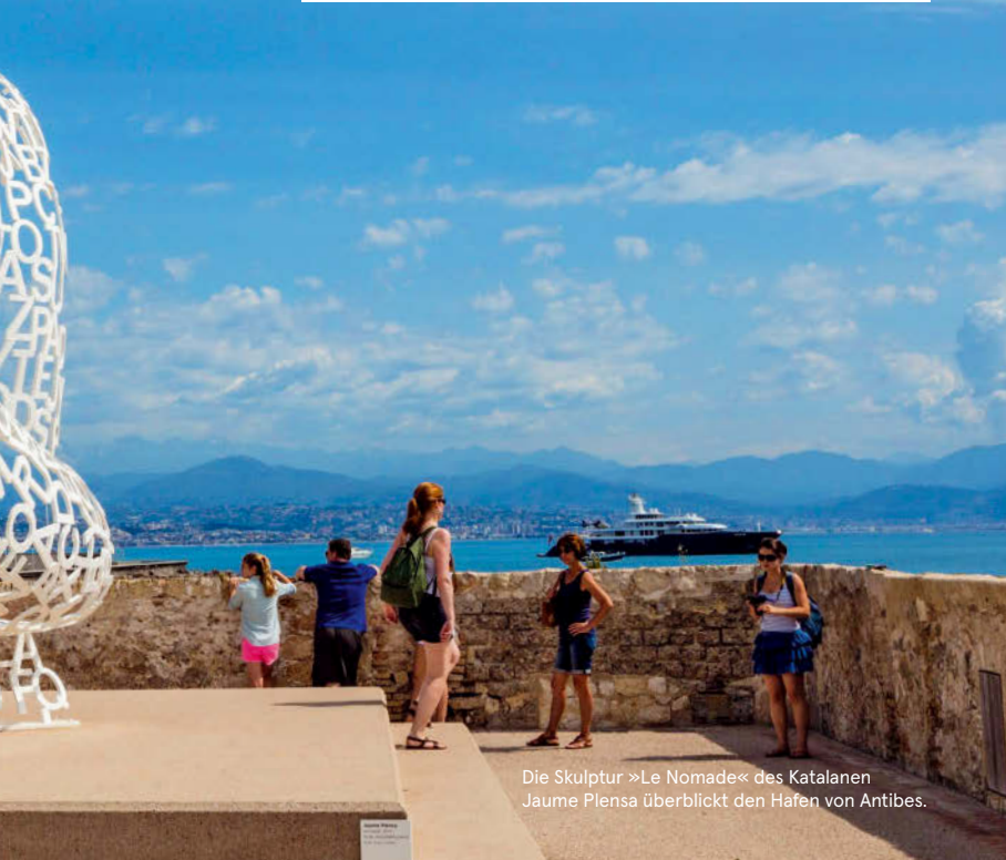
Die Skulptur »Le Nomade« des Katalanen Jaume Plensa überblickt den Hafen von Antibes.