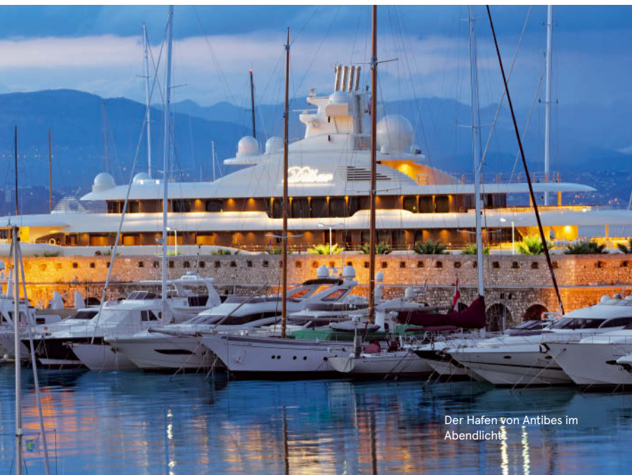
Der Hafen von Antibes im Abendlicht