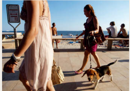
Das Schaulaufen des Sehen- und Gesehenwerdens auf den Promenaden hat im Sommer Hochsaison.

(S. 72) sind Aushängeschilder für die Opulenz jener Jahre, die sich auch im Bau von Eisenbahnlinien, Palast-hotels wie dem Négresco (S. 47), exotischen Gärten und der eleganten Promenade des Anglais von Nizza zeigten. Ab 1865 erlebte Monaco, bis 1850 ein armes Fischerdorf und Piratennest, mit Eröffnung des prachtvollen Casinos von Monte-Carlo (S. 104) seinen Boom als »spielerischer« Umschlagplatz von Vermögen der Prominenz. 1887 formulierte Stéphen Liégeard, Dichter