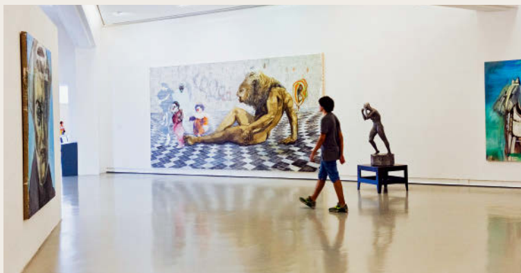
In Nizza bietet das Musée d'Art Moderne et d'Art Contemporain (MAMAC) einen faszinierenden Überblick zur zeitgenössischen Kunst.