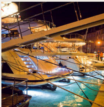
Luxusjachten im Hafen der mondänen Stadt Saint-Tropez

In der Belle Époque erlebte die azurblaue Küste ihre Blütezeit. Als Sommerziel populär wurde sie erst in den Roaring Twenties. Prominenten wie Jazz-Komponist Cole Porter und der Romancier F. Scott Fitzgerald wirkten damals als Trendsetter. Eine ähnliche Wirkung hatten später, in den 1970er Jahren, die Rolling Stones. Unter dem Einfluss der US-Amerikaner wurde das Schwimmen en vogue, während Coco Chanel eine andere Mode ins Leben rief – die Sonnenbräune. Bis dahin galt vornehme Blässe als das einzig Wahre. Anfangs nur Refugium für Millionäre und gekrönte Häupter, wurde die Côte d'Azur