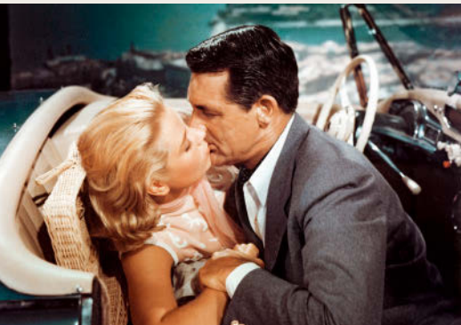
Unvergessen: Grace Kelly und Cary Grant in »Über den Dächern von Nizza« (links); Schauspielerinnen Zhang Yuqi 2013 bei der Premiere von »Der große Gatsby«