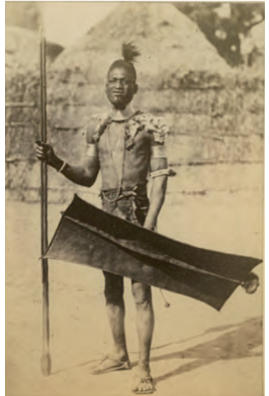
Historische Aufnahme eines Acholi-Kriegers

Königreich Toro: Ihm gehören die Distrikte Bundibugyo, Kabarole, Kamwenge, Kasese und Kyenjojo an.