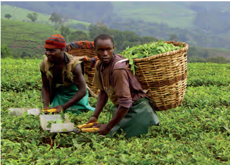
Ernte von Teeblättern im Hochland