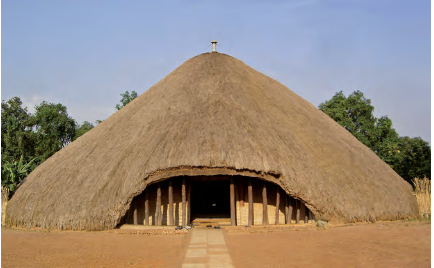
Die Kasubi-Gräber in Kampala wurden für König Mwanga und seine Nachfolger angelegt