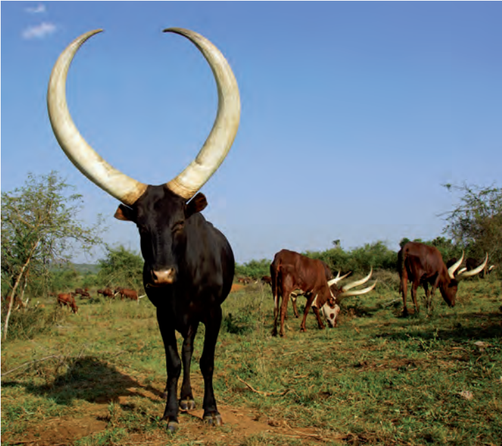
Ankole-Rind als Statussymbol

zwei Klassen geteilt. In die Rinder züchtenden Bahima und die Bairu , die Ackerbau betrieben. Das Königreich Ankole wurde regiert von einem Omugabe.