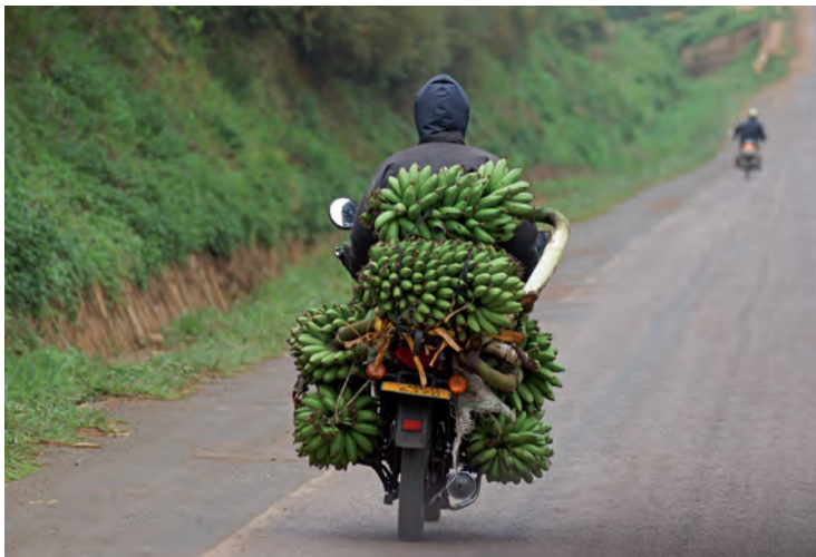
Transport von Bananenstauden