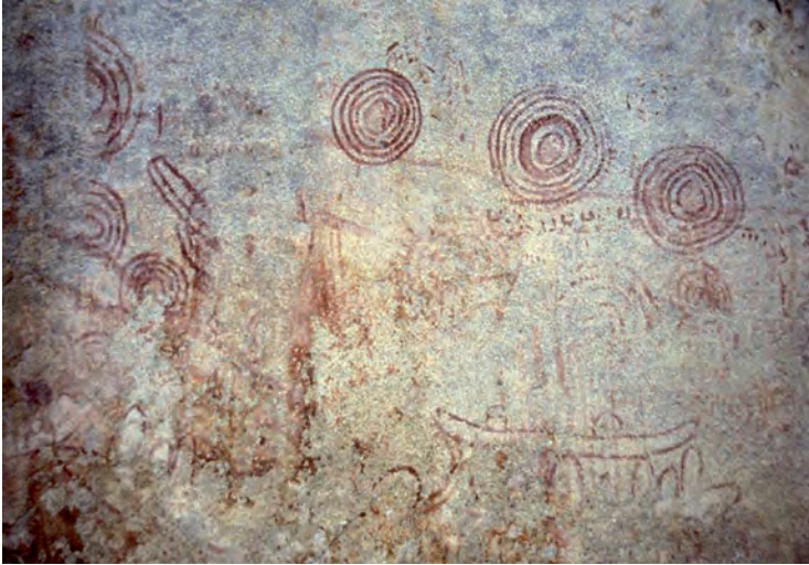
Nyero-Felsmalereien im Osten Ugandas

500 v. Chr. bis 500 n. Chr.). Seit etwa 500 v. Chr. betrieben die Bantu-Völker Ugandas Ackerbau. Ab etwa 500 n. Chr. fanden neue Feldfrüchte Einzug nach Ostafrika, wie die Süßkartoffel und die Banane. Im 10. Jh. waren die Bantu-Gruppen in weiten Teilen Ugandas etabliert und lebten in festen politischen Einheiten, in der Regel in Form von Familienclans.