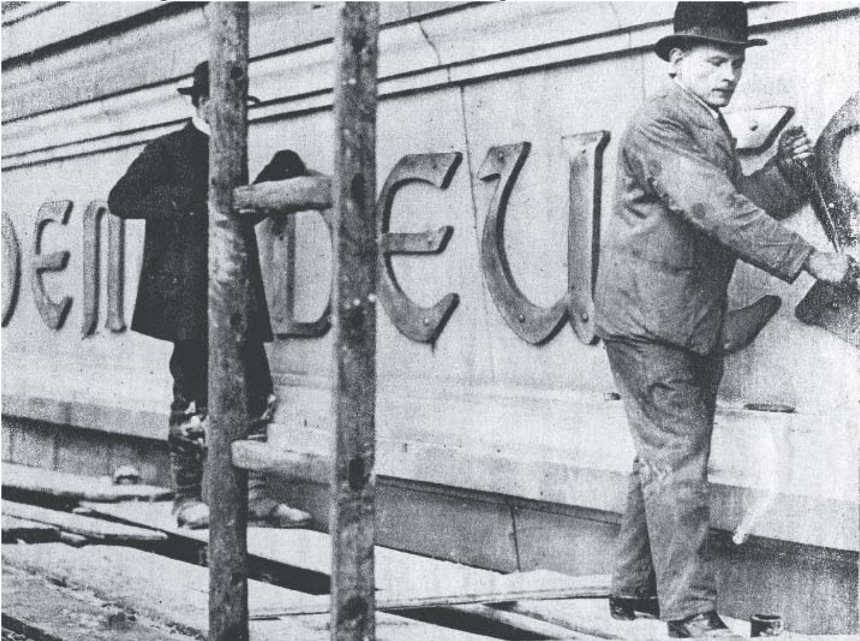
Die Anbringung des Schriftzugs „Dem Deutschen Volke“ an der Reichstagsfassade.

In Berlin war es Wilhelm II. in den 28 Jahren seiner Herrschaft gelungen, alles zu ruinieren, was er nur anfasste. Von Beginn an stand der Hohenzoller im Schatten des beliebten Generalfeldmarschalls Paul von Hindenburg (ab August 1916 Chef der Obersten Heeresleitung) und dessen Stellvertreter Generalmajor Erich Ludendorff. Wilhelm wusste, dass er bei seinen gelegentlichen Besuchen im Hauptquartier „nur der Adjutant von Hindenburg“ war und nichts zu sagen hatte.