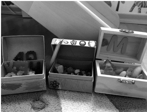
Abb.1.2: Schatztruhen mit Buchstaben (1) Glitzersteinen (2) und Diamanten und Gartensteinen (3)

Ästhetische Erfahrung vollzieht sich im Alltag, aber nicht alles was wir wahrnehmen, wird zu einer ästhetischen Erfahrung. Obwohl jedes Objekt oder jedes Erlebnis ästhetische Dimensionen der Wahrnehmung beinhalten kann, bedarf es der besonderen Aufmerksamkeit und Empfindsamkeit des Wahrnehmenden (vgl. Rumpf 2015). Damit kann alles, was wir wahrnehmen, auch eine ästhetische Dimension in der Weltaneignung enthalten. Was als solches in den Blick gerät, ist äußerst subjektiv. Während bei einem Kind vielleicht einfache Sandklumpen eine ästhetische Erfahrung hervorrufen, macht ein anderes Kind eine besondere beim Essen und ein anderes beim Sammeln oder Zeichnen. Dabei geht es um das Hervortreten von Dingen und Erlebnissen in dieser besonderen Erfahrungsdimension. Vielfach geht bei Kindern mit dieser Aufmerksamkeit eine ästhetische Verarbeitung als eine Form des Verstehens einher. Das Einordnen, Umordnen und Anordnen von Dingen in beispielsweise kleine Kästchen ist eine Weise des Systematisierens, des Verstehens und des handelnden (ordnenden) Umgangs – also Formen der ästhetischen Erkenntnis.