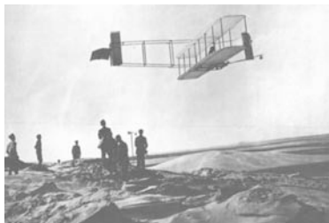
Un progetto di aereo di Leonardo da Vinci e il Kitty Hawk dei fratelli Wright

Altrettanto bizzarra dovette sembrare agli uomini di metà '800 l'idea della telegrafia senza fili esposta dallo scienziato napoletano Francesco Sponzilli in un articolo degli Annali delle opere pubbliche e dell'architettura . Quarant'anni dopo Guglielmo Marconi venne celebrato in tutto il mondo per aver realizzato la prima comunicazione radio transatlantica su una distanza di duemila miglia. Le applicazioni delle onde radio sono oggi molteplici e diffusissime: vanno dalla radaristica alla radioastronomia, dalla televisione alla telefonia mobile.