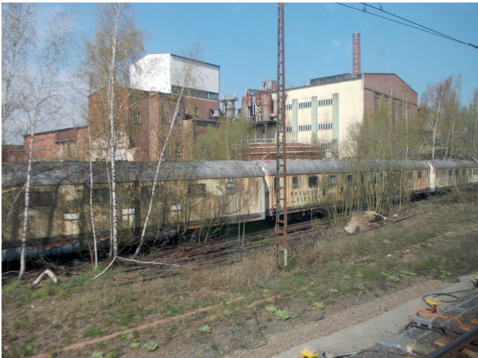
Abb. 1: Rübenfabrik Northeim

Vom Flachland aus Bremen kommend verändert sich die Landschaft kurz nach Hannover: Links Harz und Deister, rechts die Höhenzüge des Weserberglands. Auf beiden Seiten Bilderbuchlandschaften. Der Zug verlangsamt seine Fahrt und stoppt an wenigen Bahnstationen, Alfeld, Einbeck, Northeim. Ich habe die Möglichkeit, mich in gut einer halben Stunde auf die üppige Landschaft einzustimmen. Wie ein Patchwork haben sich Äcker und Felder über die Hügel gelegt, machen alle Bodenwellen des Untergrunds mit. Es herrschen Grüntöne vor, die Fluren werden von Gebüsch und Wäldchen begrenzt. Dazwischen sind Kirchtürme und die roten Dächer der Dörfer harmonisch eingebettet. Doch dann taucht zwischen Northeim und Nörten-Hardenberg ein abgewirtschaftetes Industriegelände auf. Auf einem Bahngleis wurde vor Zeiten ein Zug mit vielen Waggons abgestellt. Dahinter bestimmt die verlassene Zuckerrübenfabrik Northeim das Bild.