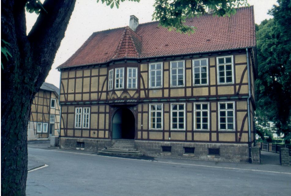
Abb. 5: Volksschule. Haupteingang mit Sandsteinplatten und Schmuckgiebel, ca. 1935

Der Eingang machte einen großzügigen Eindruck. Die Sandsteinstufen führten in einen Vorflur. Zeitzeugen bedauern, dass der Haupteingang verändert wurde. Durch das Haustürfenster konnte man nicht hindurchschauen. Die Haustür wurde auf dem städtischen Bauhof verschandelt, wird heute berichtet.