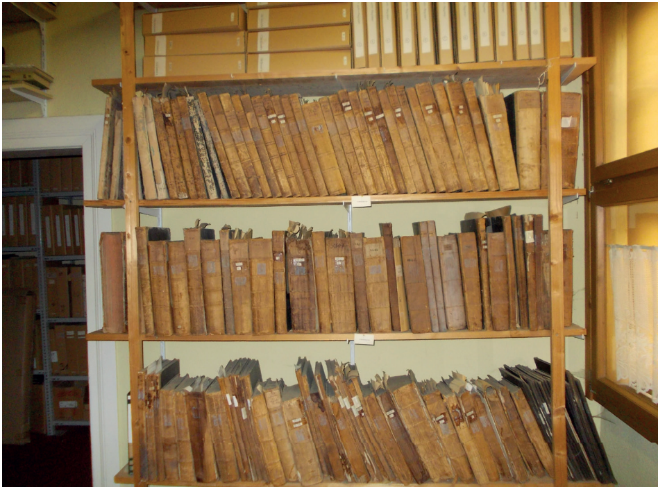
Abb. 2: Archivregal im Stadtarchiv Dransfeld