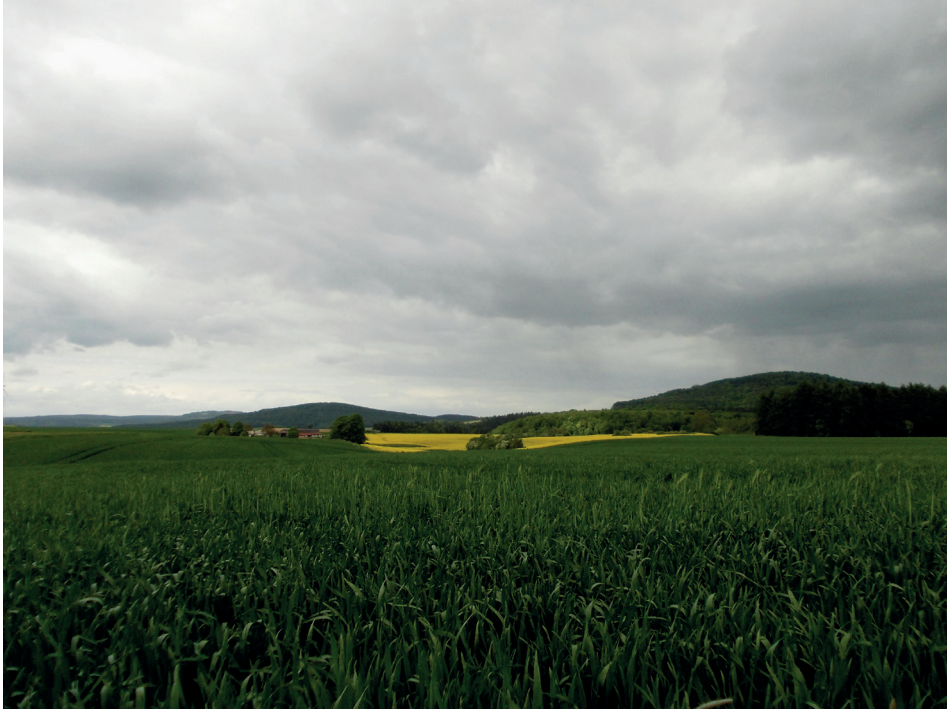
Abb. 3: Rapsfeld zwischen Dransfeld und Hann.Münden

Ich bin allen Gewährsleuten dankbar für diese Begegnungen in den Jahren 2016 bis 2018. Ich reiste in etwa monatlichem Abstand nach Dransfeld und lernte dort angenehme Menschen und die bezaubernde Landschaft kennen. Folgende biografische Skizzen sind den Informanten gewidmet. Sie werden in alphabetischer Reihenfolge vorgestellt. Im Rückblick der Akteure wird die Schul- und Kinderzeit keineswegs „schön“ geredet. Verkürzte Interviews sollen als Beispiele dienen.