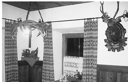
Abb. 2 und 3: Tiroler Stube im Tiroler Volkskunstmuseum und eine Stube, die in einer Zillertaler Privatvermietung als Frühstücksraum dient. 43

lichen Modernisierungsimperativs Stuben bleiben bzw. wurden neu eingerichtete Frühstücksräume mit Elementen bestückt, die Gästen das Gefühl geben sollten, sich in einer Stube zu befinden. Der Künstler Hans Linthaler nahm auf das Motiv des Herrgottswinkels im tourismuskritischen Kontext Bezug. Für eine Karikatur bediente er sich des Formats des „eingerichteten Bildes“. An die Stelle der zentralen Christusfigur trat die Figur des Touristen. Um sie herum gruppierte Linthaler Gegenstände und Bilder, die zunächst sakral anmuteten – bei näherer Betrachtung entpuppte sich aber jedes einzelne Motiv als Hinweis auf einen tourismuskritischen Argumentationsstrang. Unter der Figur des Touristen steht: „Oh Herr. Komm auch heuer wieder[,] die Schulden haun mich nieder.“ Veröffentlicht wurde die Karikatur in der Zeitschrift „Föhn. Zeitschrift fürs Tiroler Volk“, deren zweite Ausgabe im Jahr 1979 kritisch unter das Thema „Fremdenverkehr“ gestellt war. Die an der Universitätsbibliothek Innsbruck vorhandene Ausgabe der Zeitschrift trägt den handschriftlichen Vermerk „Haimayer“, was sie als persönliches Exemplar Peter Haimayers, des späteren Leiters des Arbeitskreises für Freizeit und Tourismus, auswies. Das auf den ersten Blick nebensächlich scheinende Detail lässt sich als Indiz dafür sehen, dass sich die Tourismusforschung für die tourismuskritischen Argumentationslinien interessierte oder zumindest zur Kenntnis nahm. 44