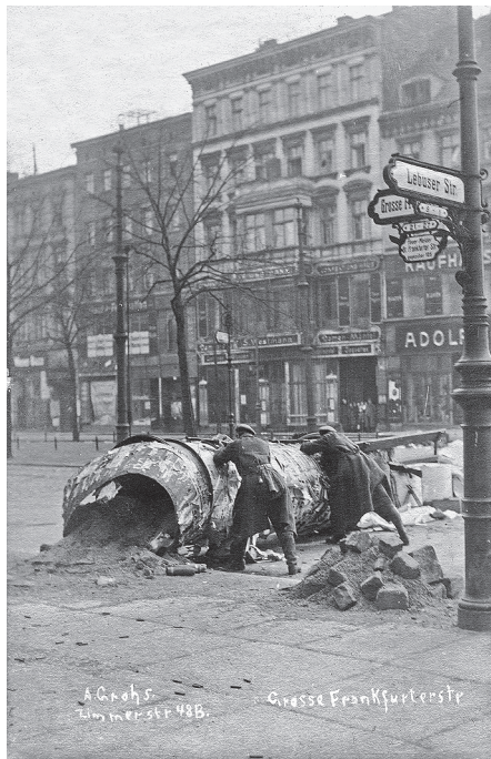
Barrikadenkämpfe während des Spartakusaufstands