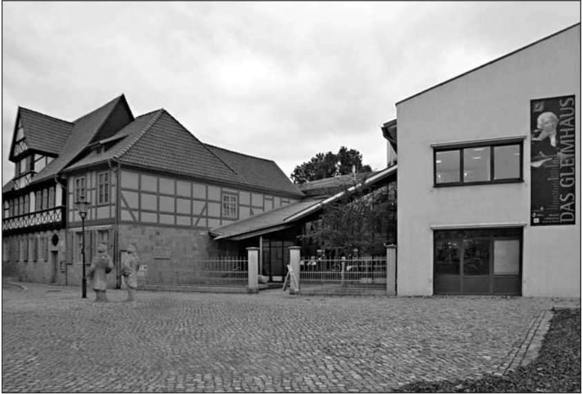
Das Glimhaus Halberstadt