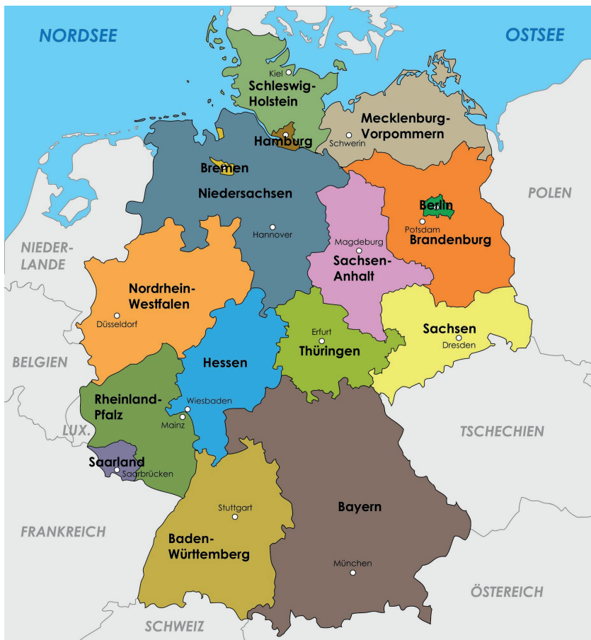
Abb. 2: Bundesländer Deutschlands