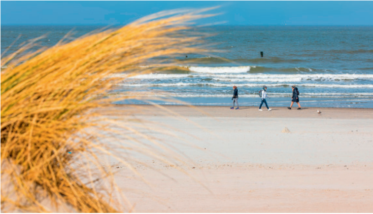
Durchatmen – einer von mindestens tausend guten Gründen für einen Urlaub an der Nordsee

hat. Trupps, die grölend durch die Straßen ziehen, sind keine Seltenheit. Eine echte Plage, finden viele. Andererseits tragen die Cluburlauber zur Saisonverlängerung bei, für viele Insulaner ein wichtiger Wirtschaftsaspekt. Die Konkurrenz der (neu eröffneten) Ostseebäder und auch die Folgen der Gesundheitsreform machten Norderney zu schaffen. 2003 stieß das Land Niedersachsen das defizitäre Staatsbad ab und überließ der Stadt Norderney alle Liegenschaften. Fördergelder erleichterten den Insulanern den Weg in die Eigenständigkeit. Und Norderney startete durch mit einer gigantischen Qualitätsoffensive und riesigen Investitionen.