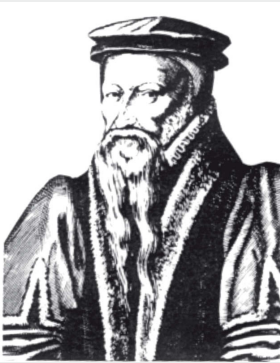
Beza im Alter von 58 Jahren. Zeitgenössischer Kupferstich nach einem Gemälde (1577)