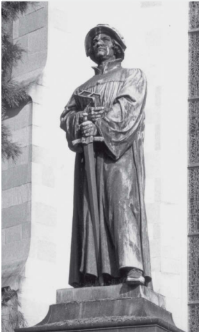
Mit Schwert in der Faust und Bibel im Arm. Bronzestatue vor Zürcher Wasserkerche (1885).