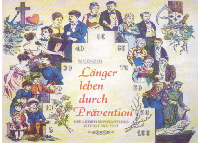
Abb. 1.1