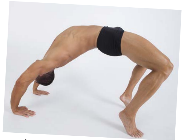
... sondern auch beweglich!

Fitness definiert sich durch mehrere Komponenten: Muskelkraft, Leistung, muskuläre Ausdauer, Herz-Kreislauf-Ausdauer, Schnelligkeit, Koordination, Balance und Beweglichkeit. Meine Workouts sprechen alle diese Aspekte in ihrer Gesamtheit an. Das Praktische dabei ist: Wenn du dich derart umfassend weiterentwickelst, stellen sich die körperlichen Veränderungen ganz von allein ein: die V-Form, eine breite Brust, eine kräftige Bauchmuskulatur und definierte Arme und Beine.