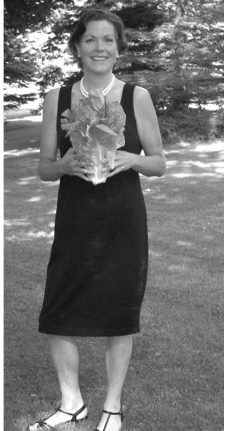
... und im Juni 2009

Tatsache ist, dass wir ein starkes Immunsystem heute dringender brauchen denn je. In den Vereinigten Staaten können Erwachsene damit rechnen, sechs- bis zehnmal im Jahr eine Erkältung zu bekommen. Alle diese Erkältungen zusammen kosten die amerikanische Wirtschaft direkt und indirekt rund 40 Milliarden Dollar. Außerdem ist es kein Vergnügen, krank zu sein. Aus einer Grippe kann beispielsweise eine lange, ernste Krankheit werden. Mediziner warnen vor möglichen neuen Grippeviren, und Viruskrankheiten breiten sich heutzutage weltweit aus. Darum ist es wichtig, dass unser Immunsystem stark bleibt und dass wir uns und unsere Familien schützen.