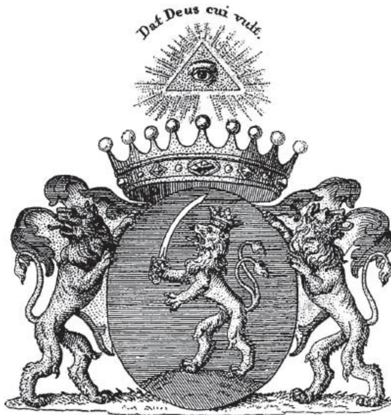
Das Wappen der Koháry, ein zweisechwänziger Löwe auf einem Berg, der einen Krummsäbel hält