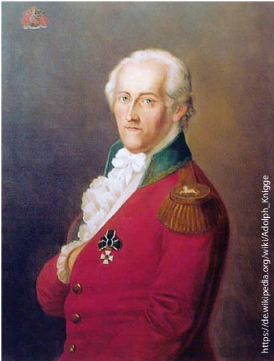
Der Schriftsteller Freiherr Adolph Knigge (1752-1796)

Damit machen Sie sich im täglichen Leben beliebt und können Eindruck schinden. Zur Berufslaufbahn „Softwarearchitekt“ hingegen schweigt die klassische Benimmliteratur.