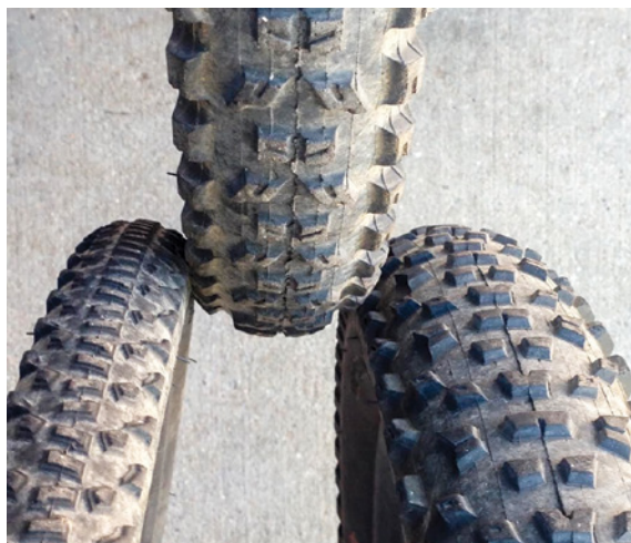
34C, 2,3 Zoll und 3 Zoll – jede Reifengröße hat ihre eigenen Vorzüge.

Finde den richtigen Kompromiss. Entscheidest du dich für eine Reifenkategorie, machst du automatisch einen Kompromiss: leichter über Bodenunebenheiten bei mehr Umfang und Gewicht, mehr Traktion bei mehr Gewicht (und vermutlich geringerer Haltbarkeit).