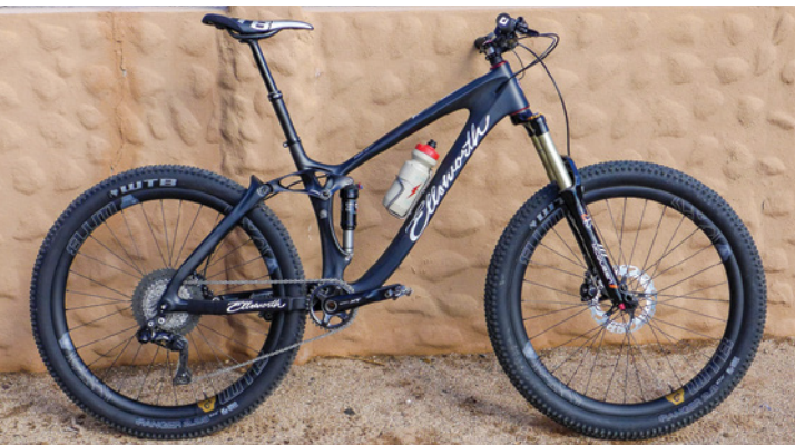
Brians Ellsworth Rogue 40

Kontra: Starker Kettenczug und starker Pedalrückschlag, was die Federung beeinträchtigt. Die Federungskurve flacht gegen Ende des Aufpralls ab, sodass es zu dem Zeitpunkt leicht zum Durchschlag kommen kann.