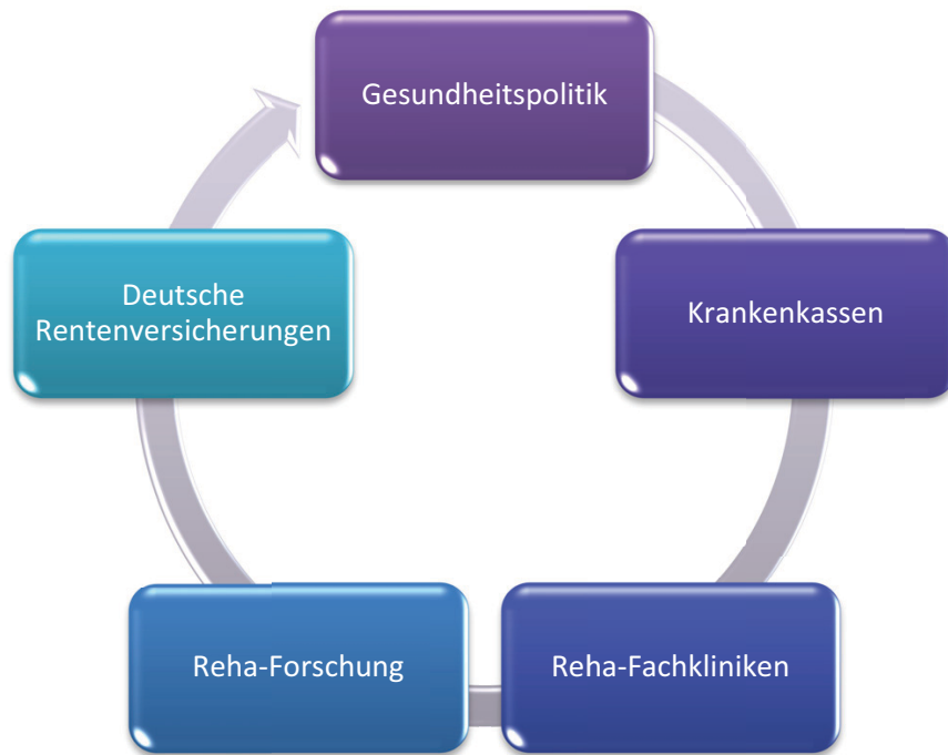
Abbildung 3 : Akteure der Freizeitforschung in der Medizinischen Rehabilitation