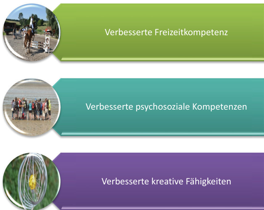
Abbildung 2: Freizeitpädagogische Therapieziele

Derzeit findet für den Bereich Medizinische Rehabilitation leider noch unzureichend spezialisierte Theoriebildung in den Erziehungswissenschaften und pädagogische Feldforschung in den Reha-Einrichtungen (unter Einbindung freizeit- und kultursoziologischer sowie entwicklungspsychologischer Konzepte und Methoden) statt. Hier sind sowohl Gesundheitspolitik, akademische Reha-Forschung, Deutsche Rentenversicherungen, Krankenkassen als auch Einrichtungsträger, Reha-Fachkliniken und Freizeitpädagogen gefordert. Diese Akteure sollten vernetzt handeln, siehe Abbildung 3.