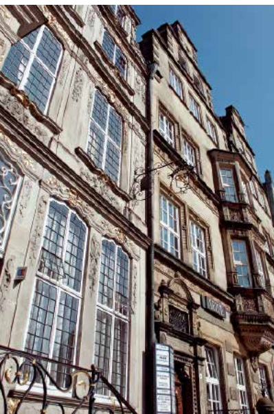
032br Abb.: nrw

Eine lebendige Bar- und Café-Szene kündigt davon, dass die Norddeutschen entgegen dem weit verbreiteten Vorurteil, sie seien spröde und kühl, kontaktfreudig und lustbetont sind. Jeden Abend kann man Spannendes unternehmen, der Kulturkalender der Stadt ist prall gefüllt.