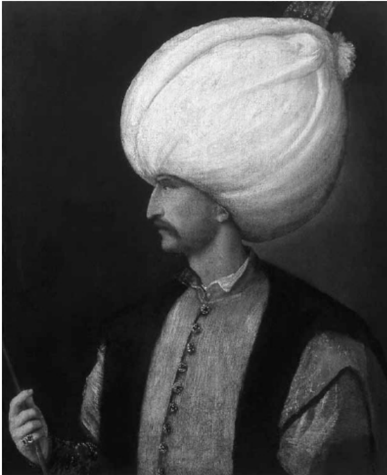
Der türkische Sultan Suleiman der Prächtige (1495–1566), venezianischer Maler aus dem Umkreis Tizians, um 1530/40.

abgeleitet ist auch das deutsche Wort „Ketzer“. In einem immerhin zähen Kampf, da diese Gegenkirche sich mächtig ausgedehnt hatte und sich auch militärisch als wehrhaft erwies, wurden die Katharer um 1340 endgültig von der päpstlichen Inquisition ausgerottet.