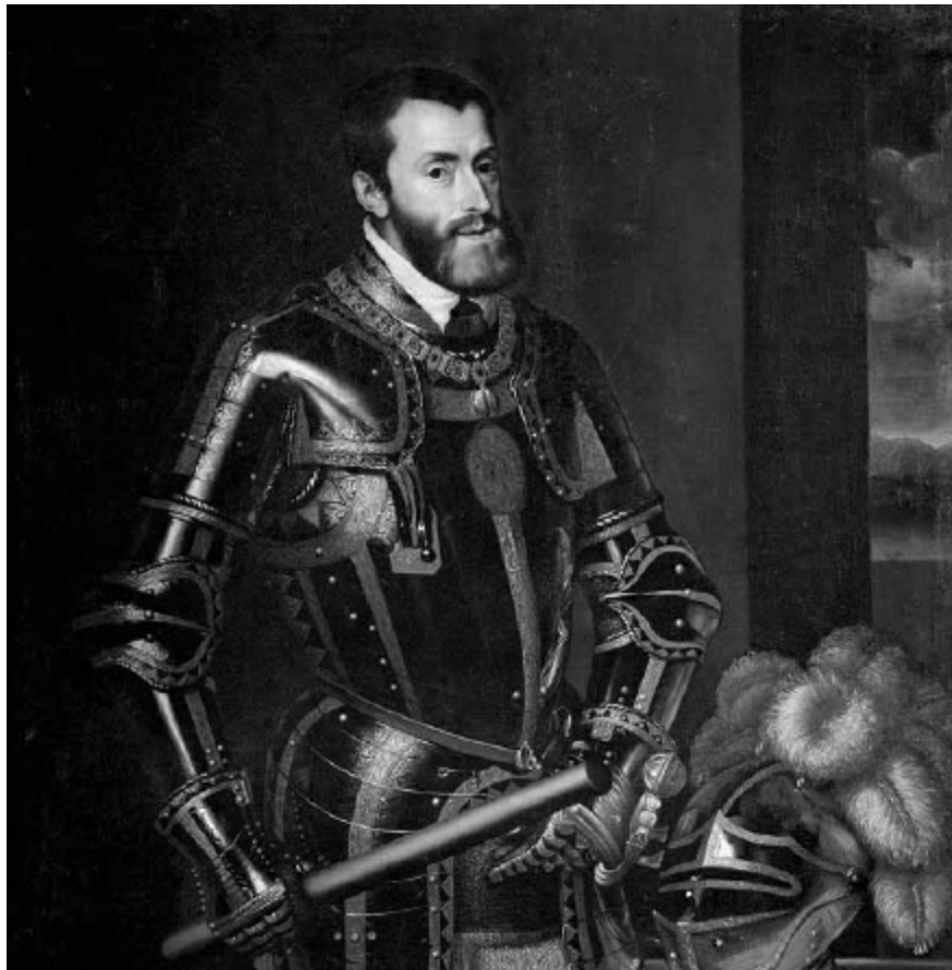
Kaiser Karl V. (1500-1558), unbekannter Künstler nach Tizian, um 1603.

eine gewisse Einigkeit zu erzeugen, damit dergleichen in seinem Reich nicht wieder vorkam. Um die Unterstützung der protestantischen Reichsstände für die Verteidigung zu gewinnen, machte er ihnen weitreichende Konzessionen, was 1532 zum Nürnberger Religionsfrieden führte. So hatte die Türkengefahr auch eine einigende Komponente für das alte und häufig krisenhafte Europa.