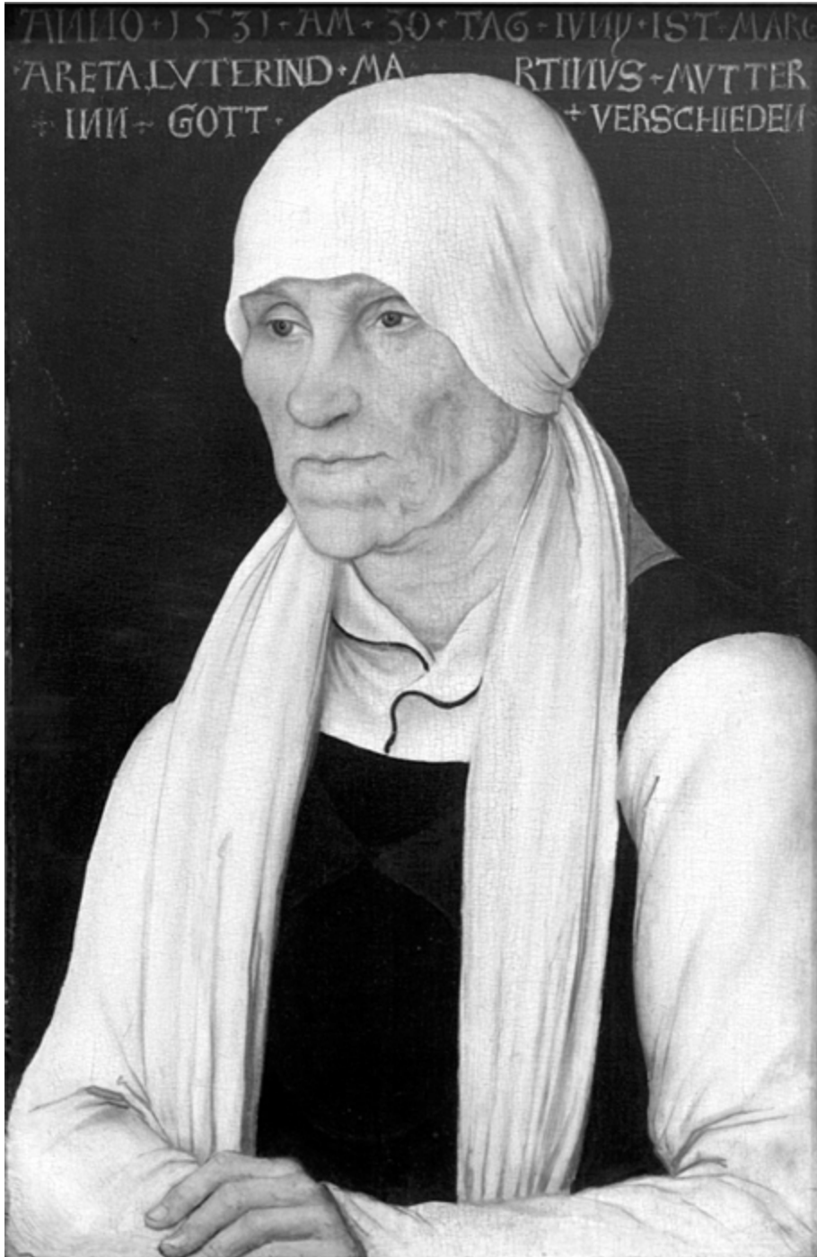
Luthers Mutter Margarete, geb. Lindemann. Gemälde von Lucas Cranach d.Ä., um 1527.

Doch selbst wenn ein solcher Antiklerikalismus vorhanden gewesen sein sollte, verhinderte er nicht eine gewisse, unter Umständen freilich sehr rudimentäre,