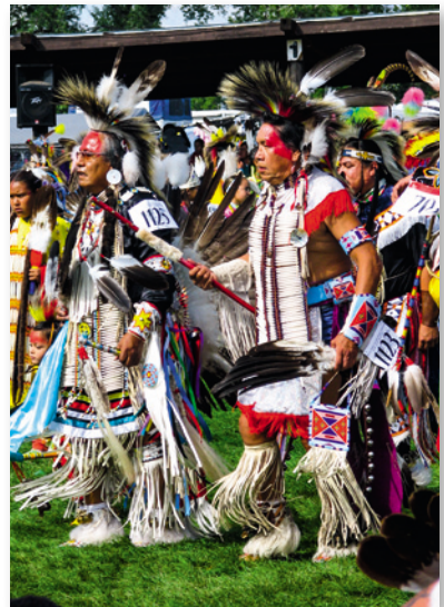
„Warriors of the Plains“

Die Tatsache, dass in Hollywood-Produktionen oder in der Abenteuerliteratur eines Karl May immer wieder Stammesnamen wie Arapaho, Blackfoot, Cheyenne, Comanche, Crow, Kiowa, Mandan oder Lakota (Sioux) auftauchen, mag daran liegen, dass deren Alltag besonders gut das Klischee vom freien, kämpferischen und – je nach Perspektive – grausamen oder „edlen Wilden“ widerspiegelt. Immerhin waren es die