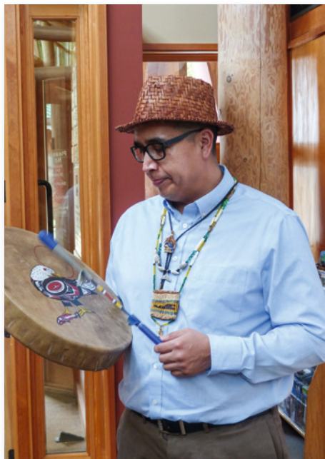
Indianer bilden die Urbevölkerung im Nordwesten

Nirgendwo in den USA leben mehr Ureinwohner als im Westen, und auch außerhalb der Reservate findet man in vielen Städten einen relativ hohen indianischen Bevölkerungsanteil. Doch entspricht das Bild weniger den edlen Klischeevorstellungen aus Filmen und Büchern – die Realität ist eine andere und zeigt auch schlechte Lebensbedingungen, Armut, Alkohol- und Drogenprobleme sowie Arbeitslosigkeit.