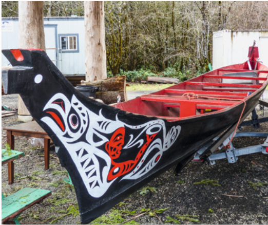
Indianer der Nordwestküste fertigen Kanus traditionell aus einem Baumstamm

Reservate, Persönlichkeiten und Ereignisse wird an passender Stelle auf der Reiseroute näher eingegangen.