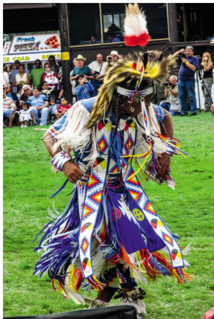
Ausdruck eines neu erwachten Selbstbewusstseins: Powwows

• Traditional Dance: Komplizierte Bewegungen, die einst zur Vorbereitung eines Kriegers auf den Kampf dienten. Sehenswert sind besonders die Seniors, die nur an diesem einen Tanz teilnehmen und besonders Wert auf ihr Aussehen legen.